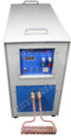
Three Phase 380V 30kW High Frequency Induction Welding Machine