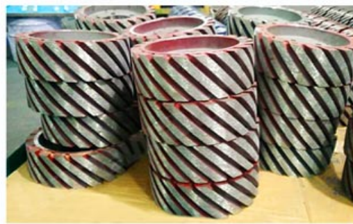
Diamond Satellite Wheel/ Rollers