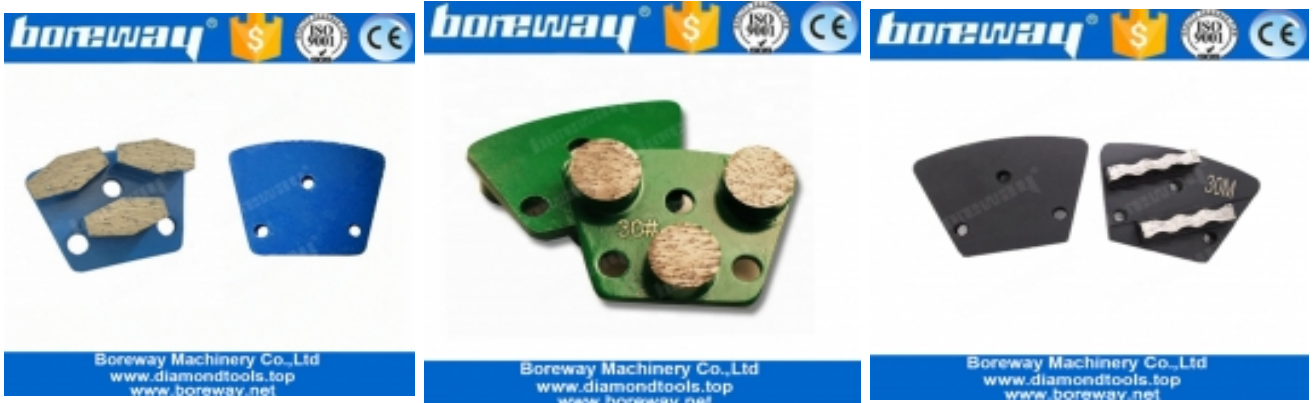
ثلاثة مسدس طحن الأحذية