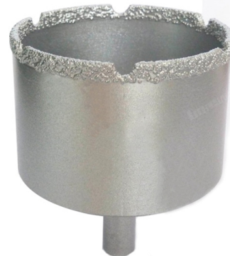
Vacuum brazed diamond core bits with round shank