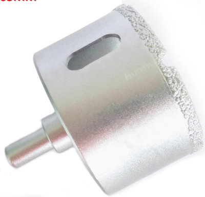
Vacuum brazed diamond core bits with round shank