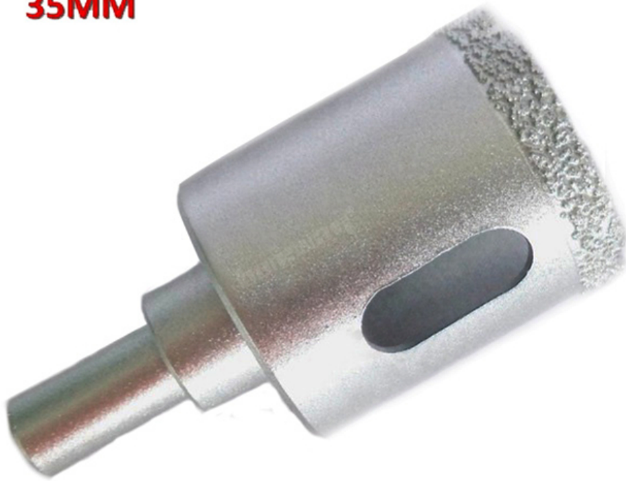
Vacuum brazed diamond core bits with round shank

Boreway Machinery Co., Ltd. www.diamondtools.top www.boreway.com