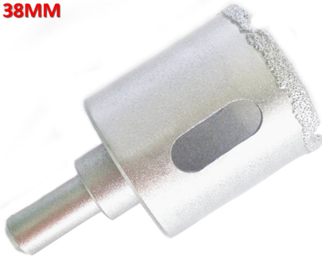
Vacuum brazed diamond core bits with round shank

Boreway Machinery Co., Ltd. www.diamondtools.top www.boreway.com