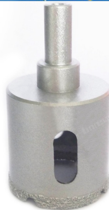
Vacuum brazed diamond core bits with round shank

Boreway Machinery Co., Ltd. www.diamondtools.top www.boreway.com