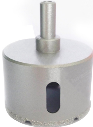
Vacuum brazed diamond core bits with round shank