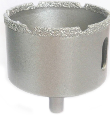
Vacuum brazed diamond core bits with round shank

Boreway Machinery Co., Ltd. www.diamondtools.top www.boreway.com