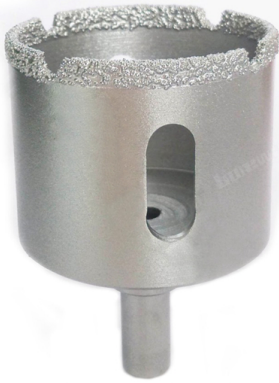
Vacuum brazed diamond core bits with round shank