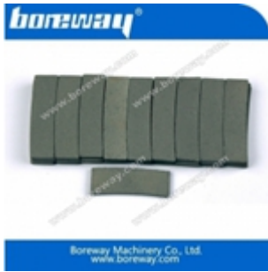
Kantenschneidsegment für Granit