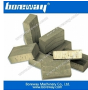
Blockschneidsegment für Marmor