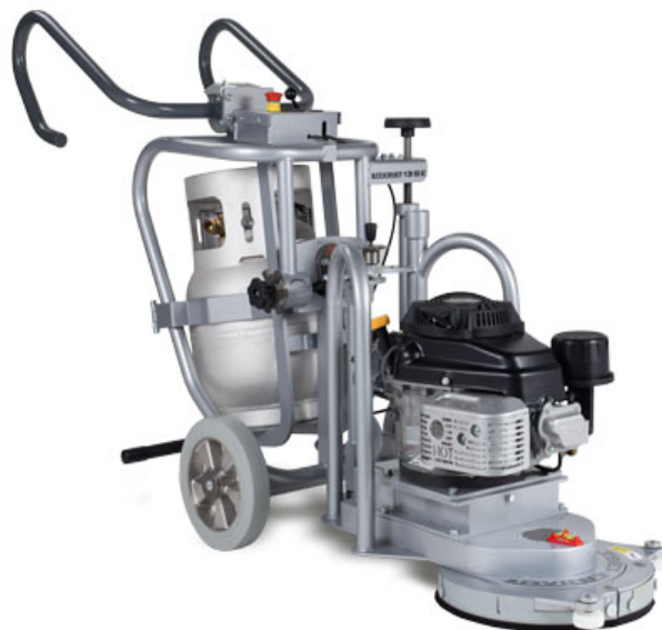
Ein Stangensegment und drei halbe PKD-Diamant-Epoxid-Bodenwerkzeuge für die Lavina-Maschine