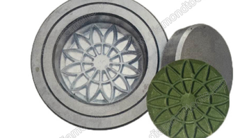
Mould for diamond floor grinding pads

Boreway Machinery Co., Ltd. www.diamondtools.top www.boreway.com