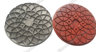
Mould for diamond floor grinding pads

Boreway Machinery Co., Ltd. www.diamondtools.top www.boreway.com