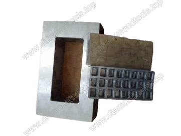
Mould for diamond floor grinding blocks

Boreway Machinery Co., Ltd. www.diamondtools.top www.boreway.com