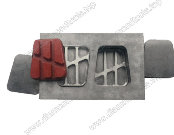
Mould for diamond floor grinding blocks

Boreway Machinery Co., Ltd. www.diamondtools.top www.boreway.com