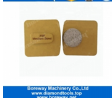
Einzelne runde Segmente Langlebige Schleifschuhe