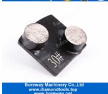
Doppeltes rundes Segment Langlebige Schleifschuhe