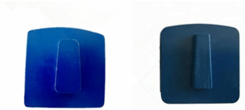
Husqvarna Redi Lock Blank Scanmaskin Blank