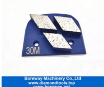
Drei Segmente, die Schuhe schleifen