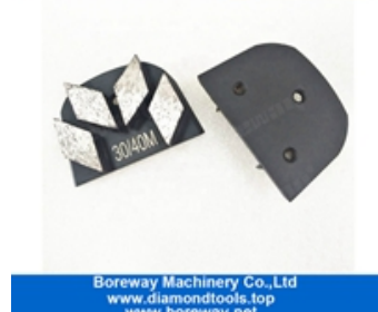
Vier Segmente Schleifschuhe