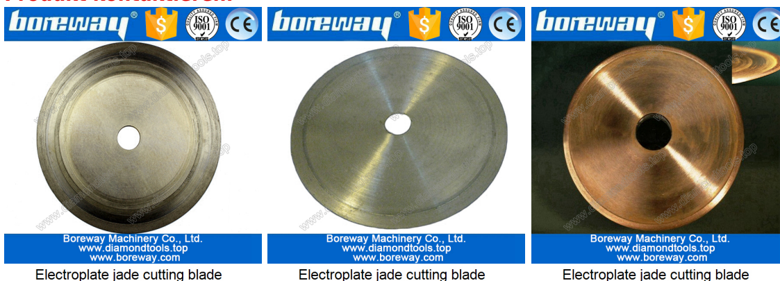
Electroplate jade cutting blade

Wenn Sie nicht das Produkt sehen, Sie möchten, können Sie uns Bilder für weitere Produkt kontaktieren.