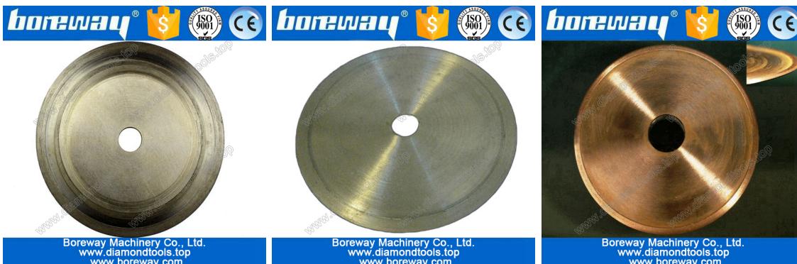
Electroplate jade cutting blade

Wenn Sie nicht das Produkt sehen, Sie möchten, können Sie uns Bilder für weitere Produkt kontaktieren.