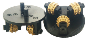
Placa de martillo de arbusto HTC

Boreway Machinery Co.,Ltd www.fordiamondtools.com www.diamondtools.top