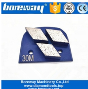
Rectificado de tres segmentos