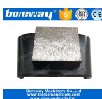
1 Grande Cuadrado Molienda Zapatos