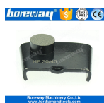
1 ronda Molienda Zapatos