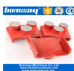
3 Redondo Molienda Zapatos