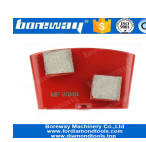
2 zapatos de rectificado cuadrados