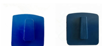
Husqvarna Redi Lock Blank Scanmaskin Blank

Nota: El logotipo especial, el tamaño y las formas del segmento, la instalación están disponibles a pedido del cliente.