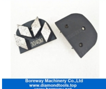
Rectificado de cuatro segmentos