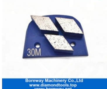
Rectificado de tres segmentos