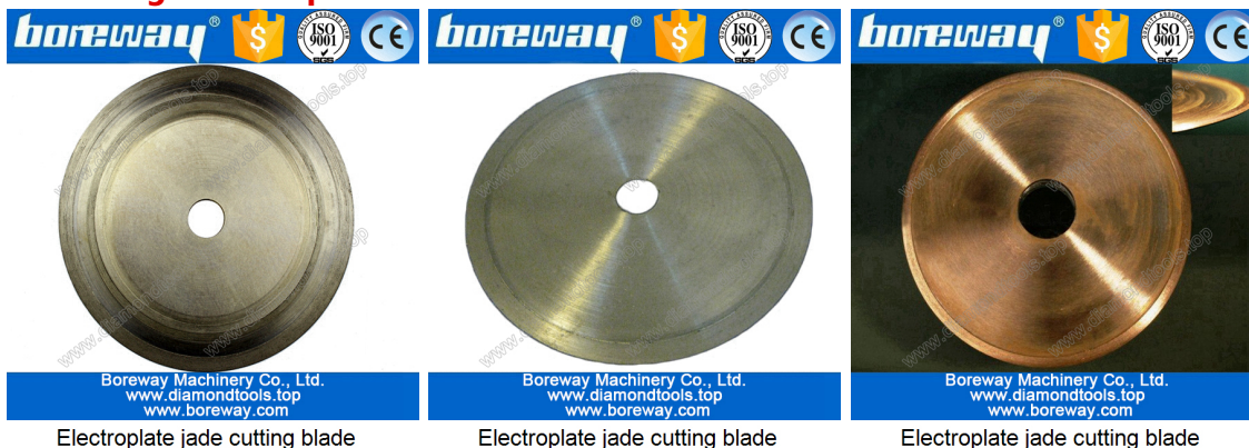
Electroplate jade cutting blade

Si no ve el producto que desea, por favor, póngase en contacto con nosotros para obtener más imágenes de productos.