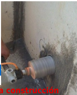
Diamond CNC drill bit

Boreway Machinery Co., Ltd. www.diamondtools.top www.boreway.com