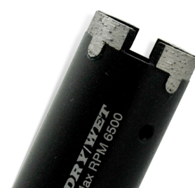
Diamond construction drill bit

Boreway Machinery Co., Ltd. www.diamondtools.top www.boreway.com