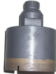
Diamond coring drill bit

Boreway Machinery Co., Ltd. www.diamondtools.top www.boreway.com