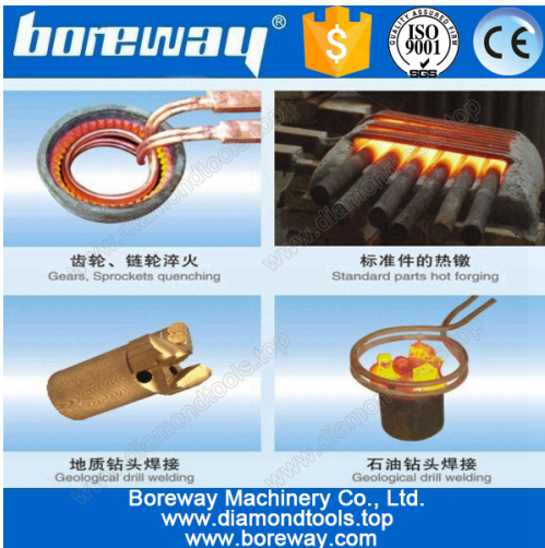
A variety of materials welding

Annexe: Commutateur de pied / main-present le commutateur, la bobine de chauffage (peut être adaptée aux besoins du client), tuyaux d'eau, pompes d'eau (besoin d'acheter).