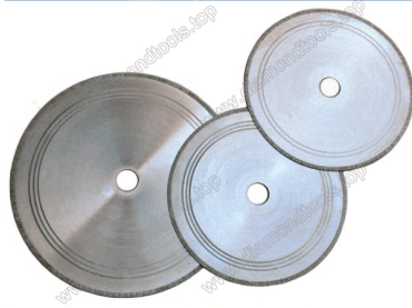
Straight teeth jade cutting blade

Boreway Machinery Co., Ltd. www.diamondtools.top www.boreway.com