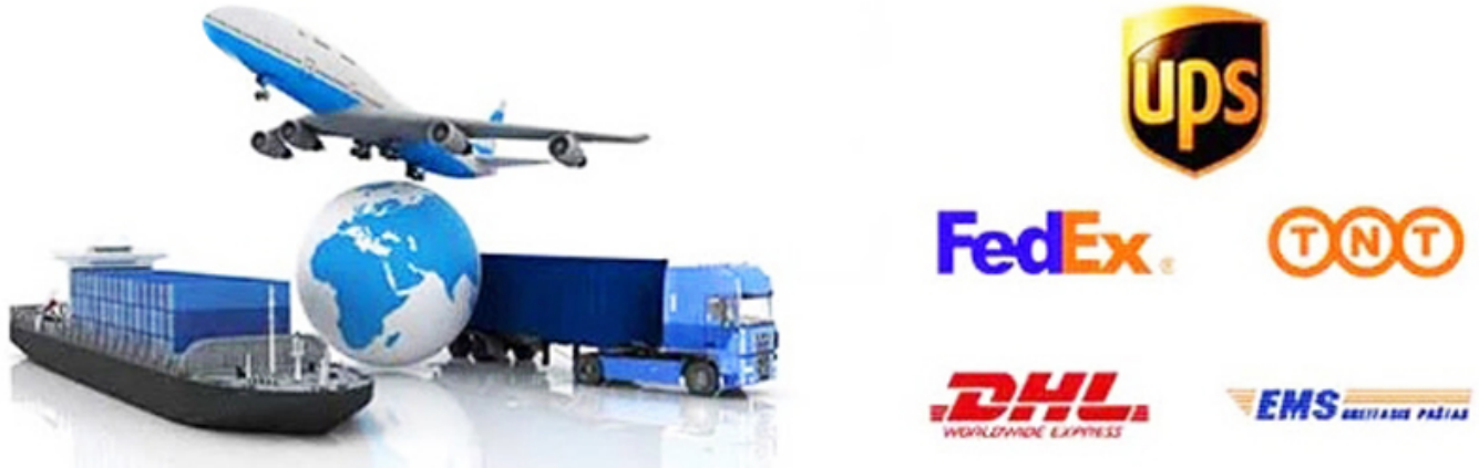
圖 示 公 司 名 稱:

運輸 公司 ， 運輸 公司 ， 運輸 公司 ， 運輸 公司 ， 運輸 公司 等 均 可 參 照 本 公 司 之 圖 示 為 準 。 該 公 司 之 圖 示 與 本 公 司 之 圖 示 有 所 不 同 ， 請 參 照 本 公 司 之 圖 示 為 準 。 該 公 司 之 圖 示 與 本 公 司 之 圖 示 有 所 不 同 ， 請 參 照 本 公 司 之 圖 示 為 準 。