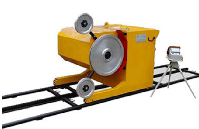
Electric Wire Saw Cutting Machine

□□□□□□□□ □□□□□□ □□□□□ □□□□ □□ □□□□ □□ □□□□ □□ □□□□ □□ □□□□ □□ □□□□ □□ □□□□ □□