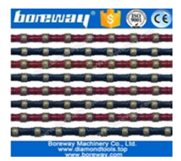
鋼絲繩 鋼絲繩 鋼絲繩