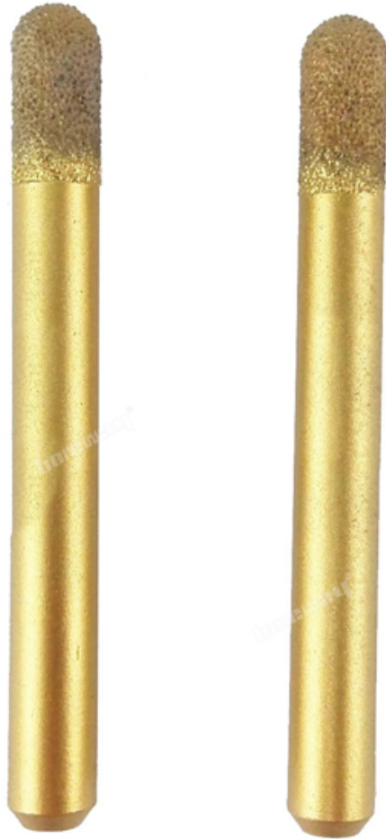
Vaccum Brazed Diamond engraving bit

Boreway Machinery Co., Ltd. www.diamondtools.top www.boreway.com