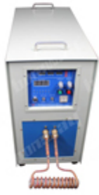
Three Phase 380V 30kW High Frequency Induction Welding Machine