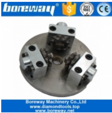
D125MMx3Tx20S 磨光機 磨光機 磨光機