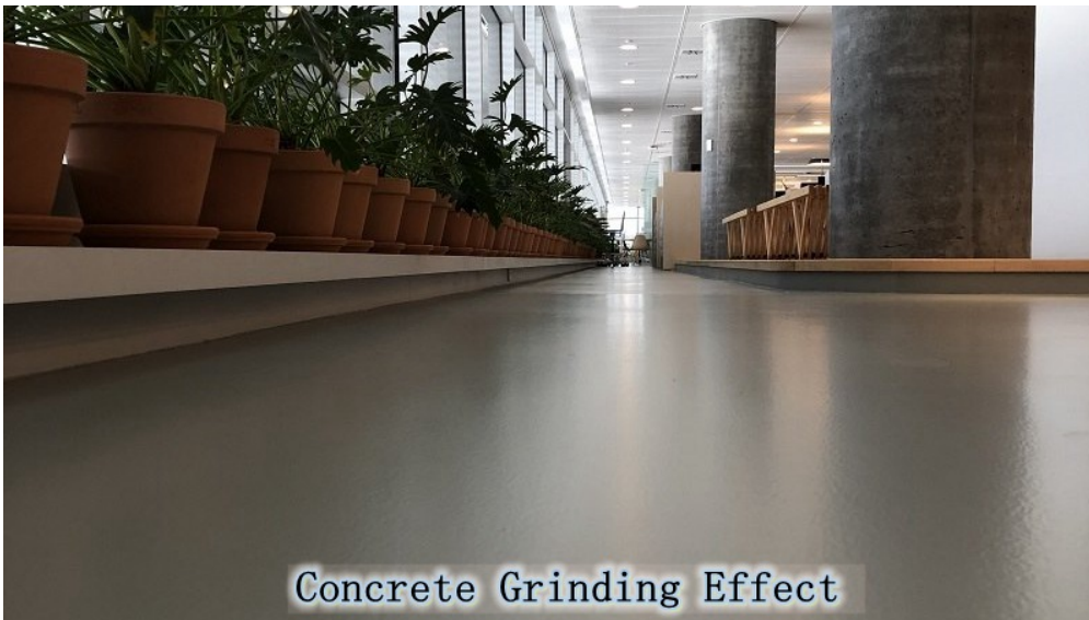
Concrete Grinding Effect