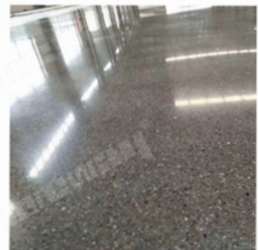
After Grinding and Polishing