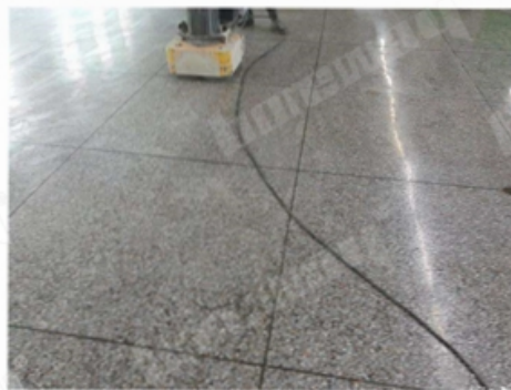
Before Grinding and Polishing