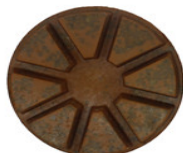
Cuscinetti per lucidatura del pavimento con metallo