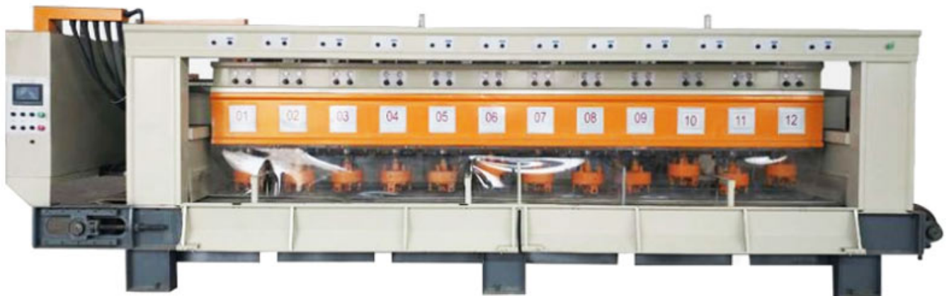
Automatic Bush Hammer Machine

Il rullo del martello del cespuglio di Francoforte è usato per textura della superficie delle pietre come granito, marmo, calcare e altri.