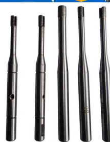
High strength diamond PC drill bit

Boreway Machinery Co., Ltd. www.diamondtools.top www.boreway.com