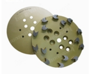
Boreway Machinery Co.,Ltd www.diamondtools.top www.boreway.net