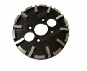
Boreway Machinery Co.,Ltd www.diamondtools.top www.boreway.net