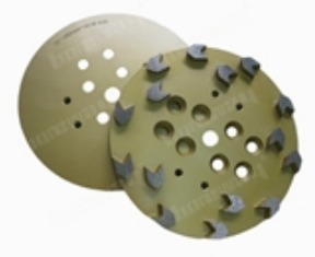
Boreway Machinery Co.,Ltd www.diamondtools.top www.boreway.net