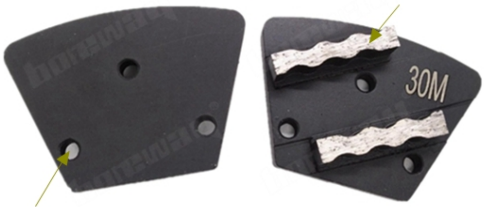
3 X M6 or M8 or Bare Holes