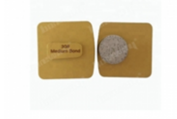
Boreway Machinery Co.,Ltd www.diamondtools.top www.boreway.net