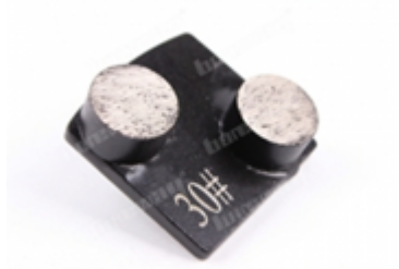
Boreway Machinery Co.,Ltd www.diamondtools.top www.boreway.net