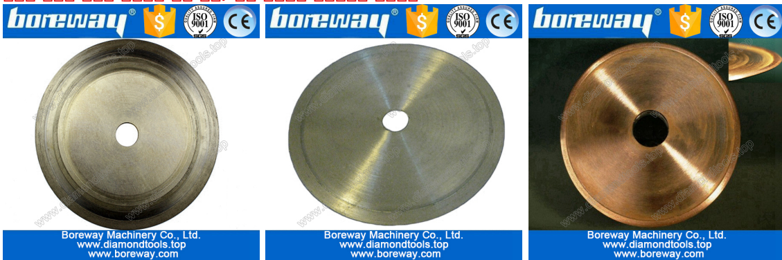
Electroplate jade cutting blade

🔍 🔍 🔍 🔍 🔍, 🔍 🔍 🔍 🔍 🔍 🔍 🔍 🔍 🔍 🔍 🔍 🔍. 🔍 🔍 🔍 🔍 🔍 🔍 🔍, 🔍 🔍 🔍 🔍 🔍 🔍 🔍.