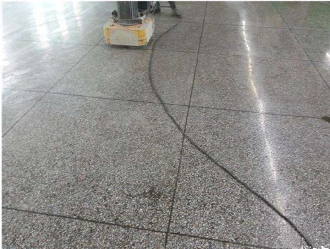
Before Grinding and Polishing