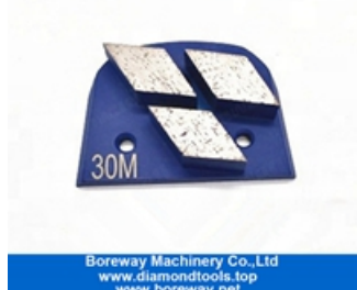
Três segmentos de moagem de sapatos