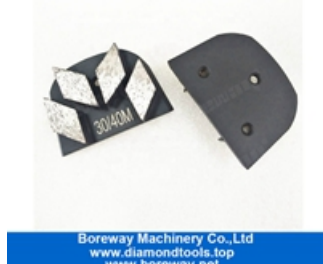
Quatro segmentos de moagem de sapatos