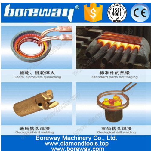
A variety of materials welding

Anexo: Interruptor de pé / interruptor da mão-imprensa, bobina de aquecimento (pode ser personalizado), tubulações de água, bombas de água (necessidade de comprar).