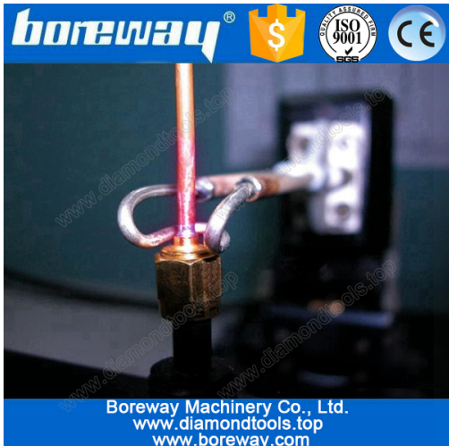
Copper tube welding