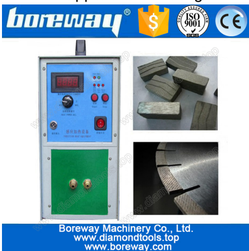
Diamond saw blade welding