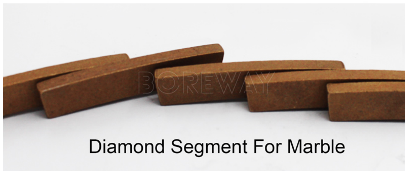
Diamond Segment For Marble