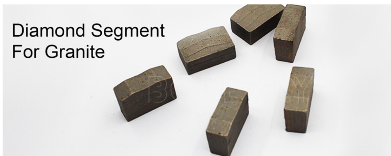
Diamond Segment For Granite