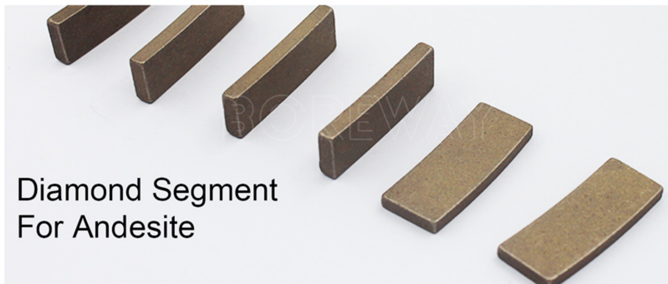
Diamond Segment For Andesite

Bom segmento de diamante de vida afiada e longa para o fabricante e fornecedor