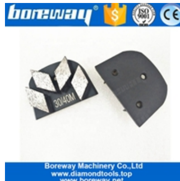
Quatro segmentos de moagem de sapatos