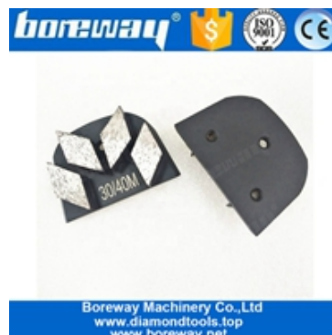
Sapatos de esmeril de quatro segmentos