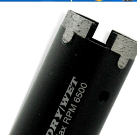
Diamond construction drill bit

Boreway Machinery Co., Ltd. www.diamondtools.top www.boreway.com