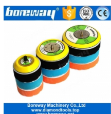
5/16 "-24 нить Vacker Pad