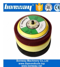
5-дюймовая пенная подушка