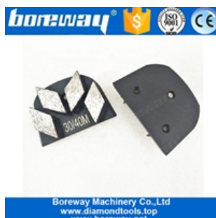
Шлифовальная обувь из четырех сегментов