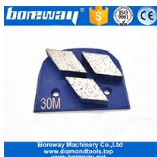
Шлифовальная обувь из трех сегментов