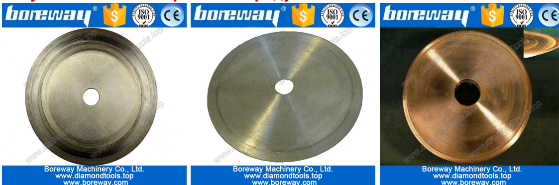
Electroplate jade cutting blade

Если вы не видите продукт, который вы хотите, пожалуйста, свяжитесь с нами для получения более изображений продукта.